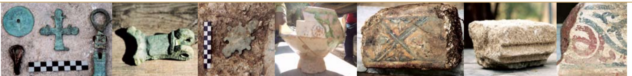
ახლად აღმოჩენილი არქეოლოგიური მასალა და არქიტექტურული ფრაგმენტები Newly discovered archaeological materials and fragments of architecture